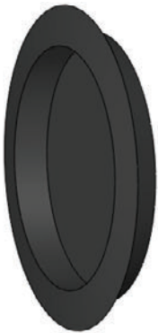
Tapón al ras de hule de 1": 2 piezas