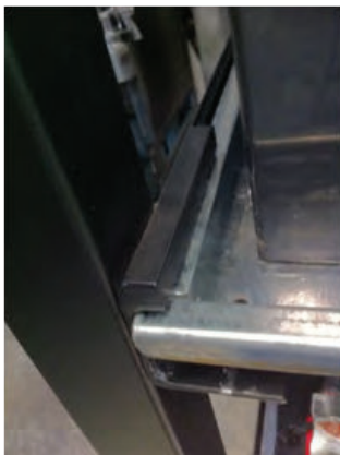
Topes frontales redondeados