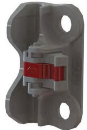
Bisagras de fácil desmontaje: 4 piezas