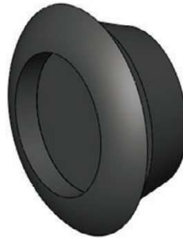
Tapón al ras de hule de 3": 3 piezas