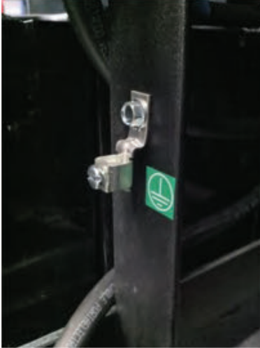
Terminal de Tierra: 1 pieza